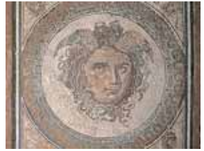
Mosaico de la Medusa 3