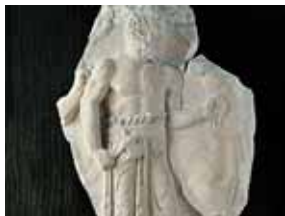
Relieve del Sacrificador 8