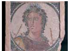
Euterpe, musa de la música. Mosaico 12