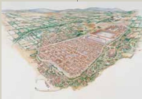
Tárraco, s.II. Reconstrucción hipotética