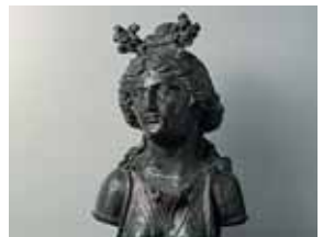
Diana. Ponderal de una balanza 6