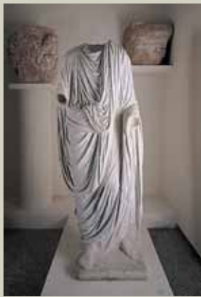
Togado. Teatro romano 1