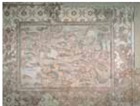
Mosaico de los Peces 7