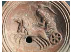
Lucerna con escena de circo 5

En época romana, las grandes villas campestres eran además de lugares de ocio y distracción, centros de producción agrícola y ganadera. Se han localizado diversas villas en el territorium de Tárraco, entre las que cabe destacar la de Centelles (Constantí) y la de Els Munts (Altafulla). En esta última se ha descubierto un importante núcleo residencial, un conjunto termal y ricos elementos que conformaban su decoración escultórica y arquitectónica. Su suntuosidad confirma que fue la residencia de un destacado personaje de la administración local de Tárraco.