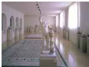
Vista general de las salas VIII y IX 10 11