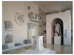
Vista general de la sala II 2

La buena situación de Tárraco en relación a las rutas marítimas y la facilidad para las comunicaciones terrestres permitieron el desarrollo y el enriquecimiento de la ciudad. Su puerto fue –primero– el lugar de llegada del ejército y –más adelante– la puerta de entrada del comercio, de la cultura y de una nueva organización social y política, el Imperio romano, organizado alrededor del Mediterráneo. Muchas de las piezas expuestas en esta sala proceden de hallazgos submarinos y constituyen una significativa muestra del transporte y del comercio marítimo.