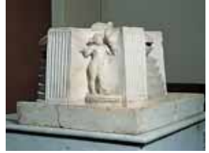
Fragmento de una fuente 4