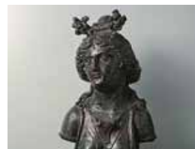
Груз для весов «Диана» 6