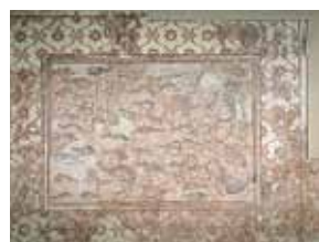
Мозаика «Рыбы» 7