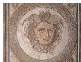
Мозаика «Медуза» 3