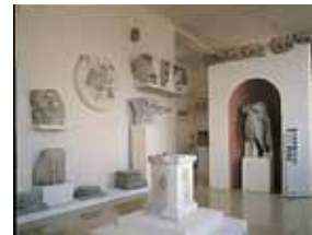
Общий вид зала II 2

Выгодное расположение Таррако по отношению к морским путям и хорошие условия для наземного сообщения явились решающими факторами для развития и процветания города. Его порт был, во-первых, местом высадки римской армии, а затем и воротами для развития торговли, культуры и установления нового социального и политического порядка – Древнеримской империи, раскинувшейся вокруг Средиземного моря. Многие из экспонатов этого зала были подняты с морского дна и представляют собой прекрасные свидетельства уровня развития морского транспорта и торговли.