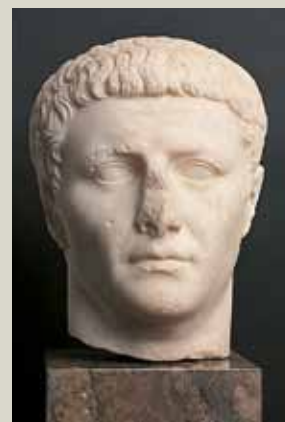
Портрет императора Клавдия 9