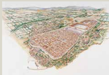
Таррако, II век. Виртуальная реконструкция