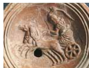
Лампа со сценой из цирка 5

В эпоху Древнего Рима большой сельские виллы были как местом отдыха и развлечений, так и центрами сельского хозяйства и животноводства. На территориях, принадлежавших Таррако, были найдены различные виллы, среди которых необходимо отметить Сентсельес (г. Константи) и Эльс Мунтс (г. Альтафулья). В последней была найдена довольно крупная жилая часть, термальный центр и богатые элементы, которые составляли ее значимый скульптурный и архитектурный ансамбль. Роскошь обстановки свидетельствует о том, что вилла была резиденцией какого-то выдающегося персонажа из местной администрации древнего Таррако.