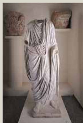
Облачения. Римский театр 1