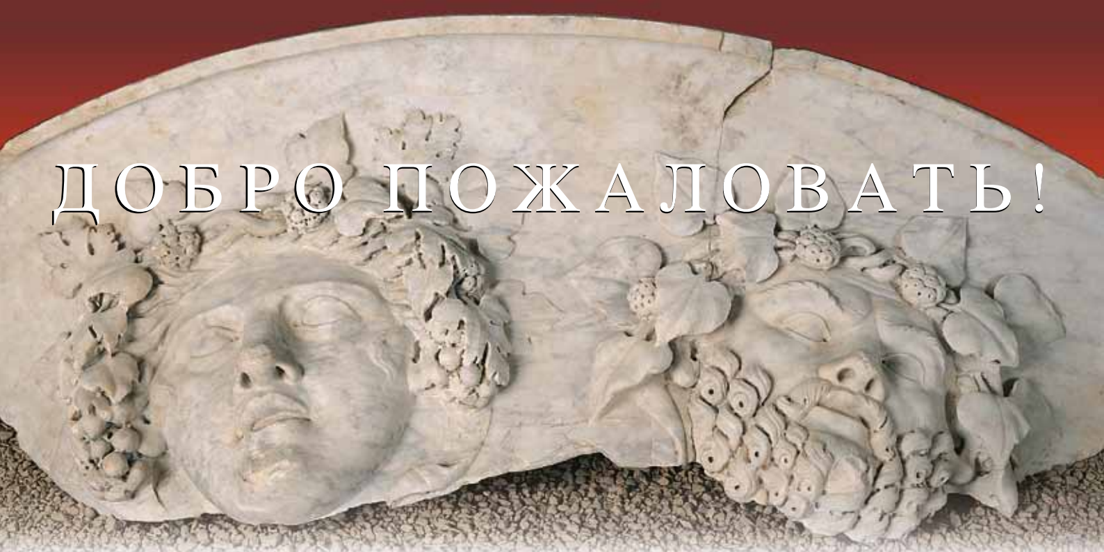
Фрагмент монументальной чаши Провинциального форума

Другие достопримечательности древнеримской эпохи