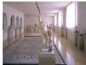
Общий вид залов VIII и IX 11