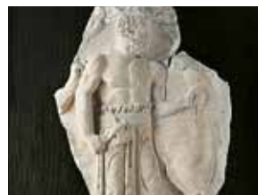
Барельеф «Жрец» 8