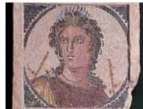
Мозаика «Эверта, муза музыки» 12