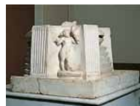
Фрагмент фонтана 4