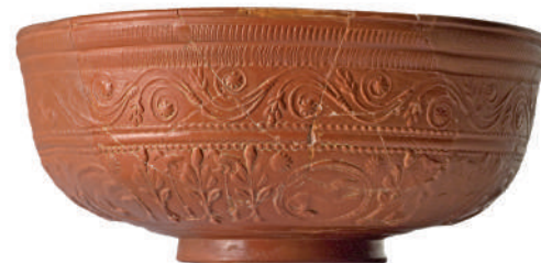
Bol de terra sigillata Segle I dC Ceràmica

Us proposem realitzar un bol de terra sigillata.