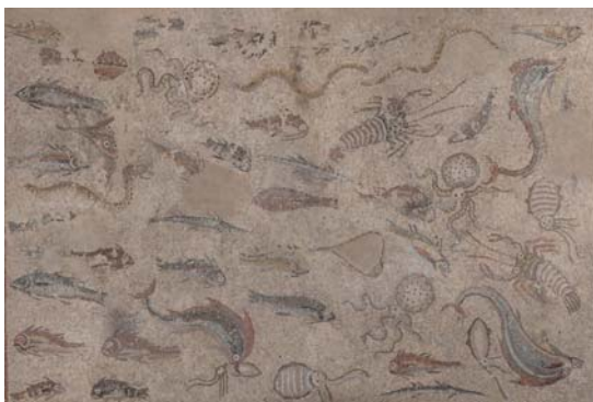
Opus tessellatum . Segle III dC

Una de les tècniques més conegudes és la dels mosaics fets amb amb tesselles, petites pedres de colors de 1x1 cm aproximadament, com el mosaic dels Peixos. Però al Museu també podem observar mosaics fets amb fragments de marbre més grans ( opus sectile ) o amb pedretes molt petites formant files en forma de cucs ( opus vermiculatum ) com el famós mosaic de la Medusa.