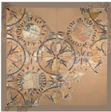
Opus sectile . Segle I dC