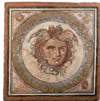
Opus vermiculatum . Segle II- III dC